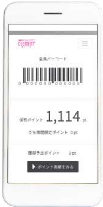
クレメントプラザクラブカード (デジタル会員証)