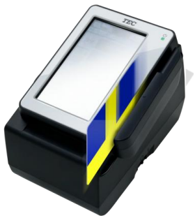
Tポイント専用端末 東芝テック社製 CT-4100 シリーズ