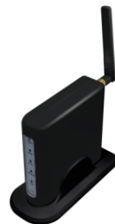
無線ターミナル (オプション)